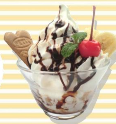
小玉屋パフェ 480円 (税込519円)