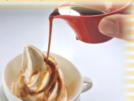
アフオガード 480円 (税込519円)