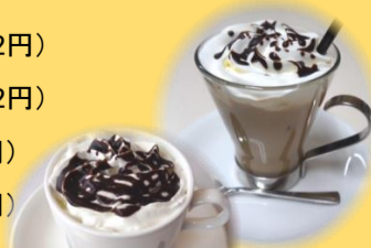
カフェショコラ (ホットorアイス)