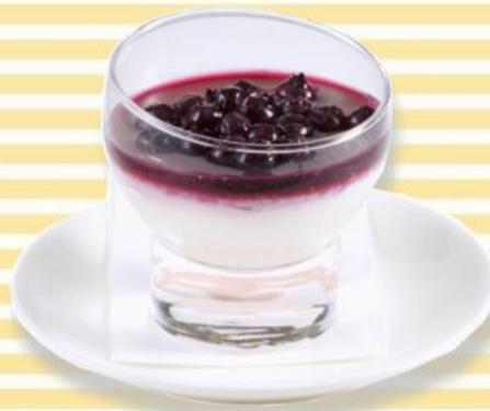
ブルーベリームース 400円 (税込432円)