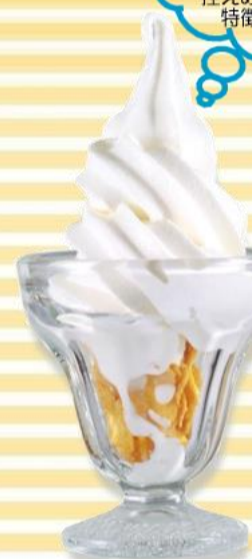
ソフトクリーム 290円 (税込313円)