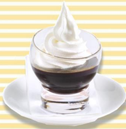
コーヒーゼリー 400円 (税込432円)