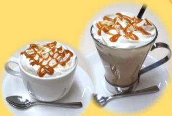
キャラメルマキアート (ホットorアイス)